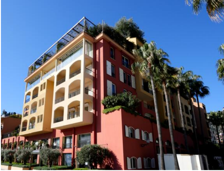
QTC - Appartement - 5 pièces sur 1 niveau Troisième Étage